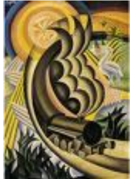
Fortunato De Pero: "Treno partorito dal sole" (1910)

No, l'uomo non è nato per tener le mani legate al palo delle preghiere. E Dio non vuole ginocchia umiliate nelle chiese, ma gambe di fuoco che galoppano, mani che accarezzano viscere di ferro, menti che generano fiamme e braci, labbra che danno baci. Dico che io vivo, penso, lavoro e che questo che faccio è un buon pregare, che a Dio gli piace molto e ne rispondo. E dico che l'amore è il migliore sacramento, che amo, che vi amo, e che non ho un posto nell'inferno.