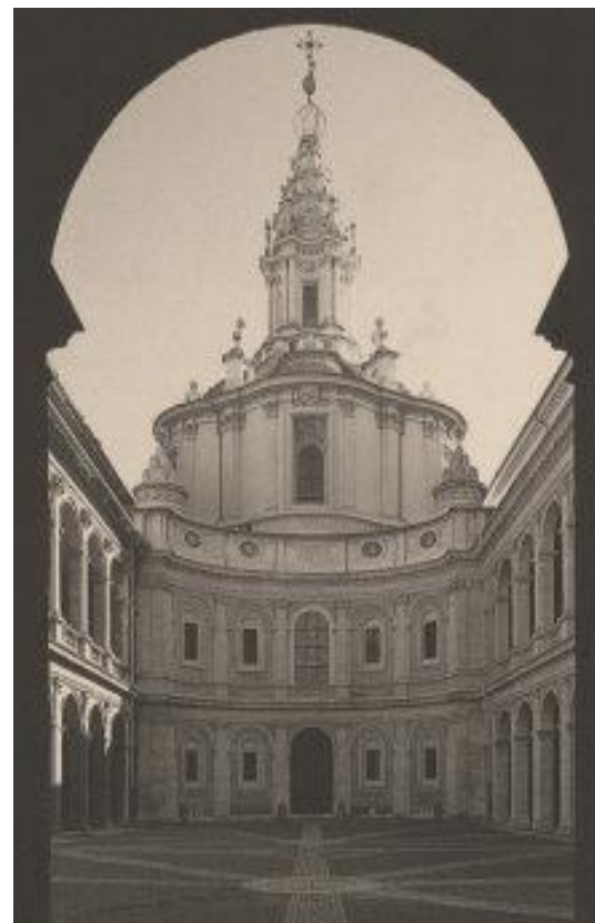
Chiesa di S.Ivo alla Sapienza

E' un ambulatorio legale , in cui l'avvocato "di base" dà il consiglio che equivale alla prescrizione del farmaco, molto spesso decisivo; o assiste il cliente nella risoluzione di controversie che non necessariamente devono avere uno sbocco giudiziale, in procedure "para-giudiziali" o di volontaria giurisdizione (es. ricorsi al giudice tutelare, accettazioni di eredità, cancellazione di protesti, separazioni consensuali) che non comportino il ricorso al giudice in sede contenziosa