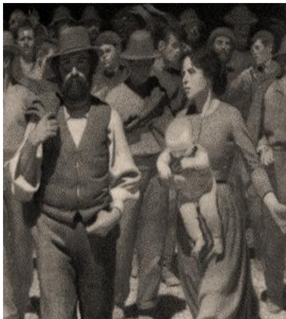
Giuseppe Pellizza: "Il quarto stato" (1901)